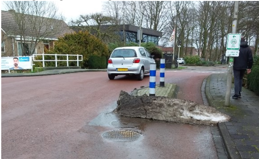
17 februari – (middag)

Hier liggen hier op de Hoogewaard K'kerk diverse bulten (rest)sneeuw en met name tussen de vluchtheuvels en trottoirs en dat is precies op de fietsstrook (links zowel als rechts). Als fietser moet je dus links langs de verkeersheuvel/-zuil / slalommen- en dat is vlg de regels niet toegestaan.