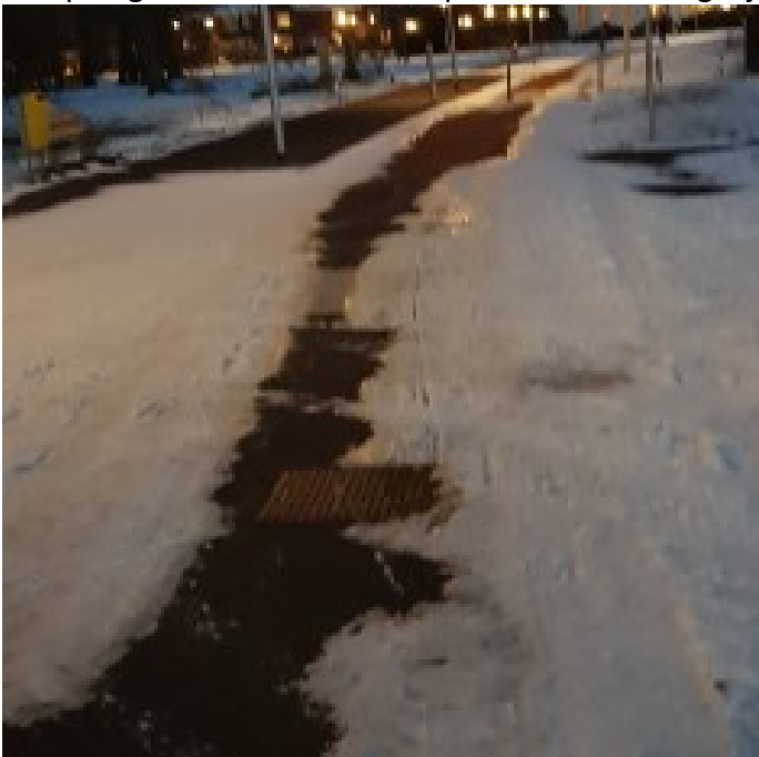
12 februari ('s avonds)