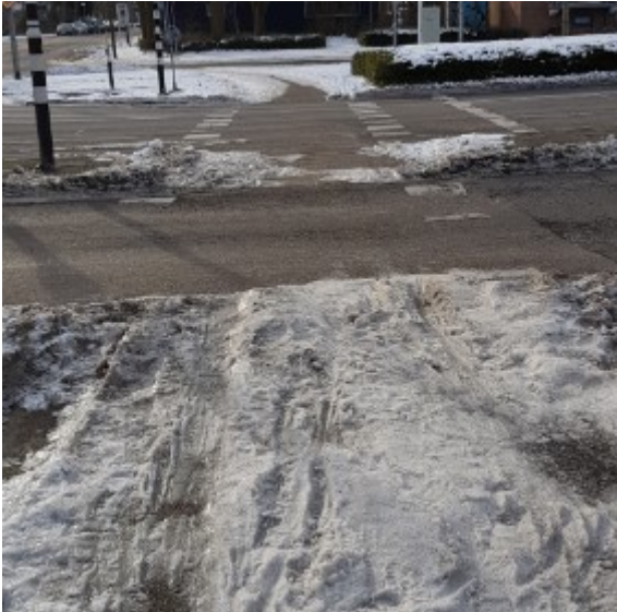
14 februari ('s ochtends)