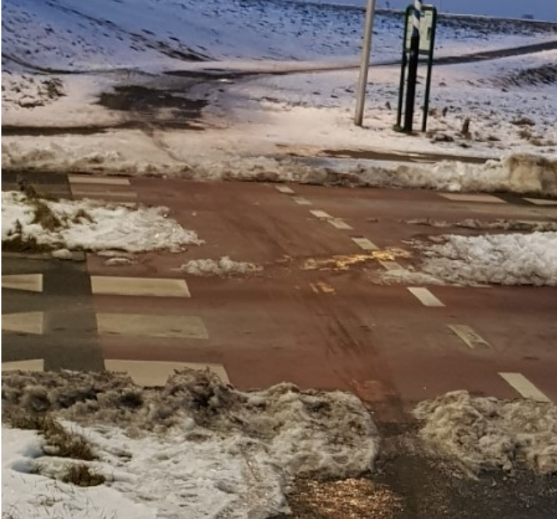
12 februari ('s avonds)