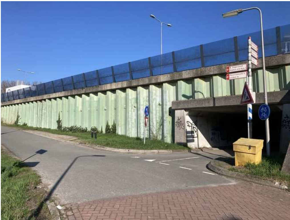
Oude oprit vanaf Kortsteekterbuurt, vlakbij de fietstunnel.

Een tweede besparing dacht men te bereiken aan de noordwestzijde van de Steekterbrug. Daar ligt een oprit vanaf de Kortsteekterbuurt, omhoog naar de Oranje Nassaubrug. Deze oprit is steil, en begint dicht bij een fietstunnel onder de N207 door. Zo dicht bij, dat je slecht zicht hebt vanuit de tunnel op de oprit/afrit, en omgekeerd. Er zou een nieuwe oprit komen voor de fietsers: minder steil, en verder bij de (nieuwe) tunnel onder de N207 vandaan. Idee van de besparing was om maar gewoon de oude oprit te behouden. Opnieuw: niet goed voor de veiligheid.