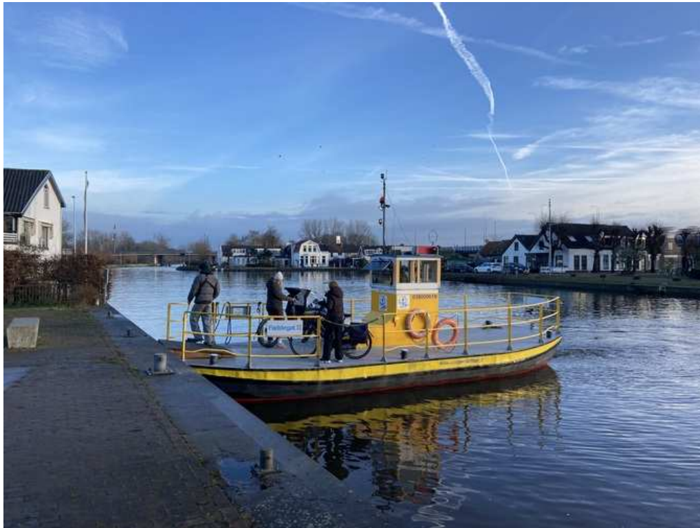
Pontje over de Gouwe bij de Hefbrug.

Dit laatste bleek niet helemaal te kloppen: de werkzaamheden duurden 's avonds tot 23.30 uur, zodat je tussen 22.00 uur en 23.30 uur echt de Gouwe niet over kon, wat we bij een test ook constateerden.