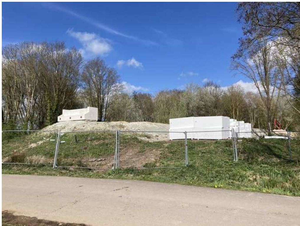
Bruggenhoofd (links) en piepschuim (rechts) aan westzijde van Aarkanaal.