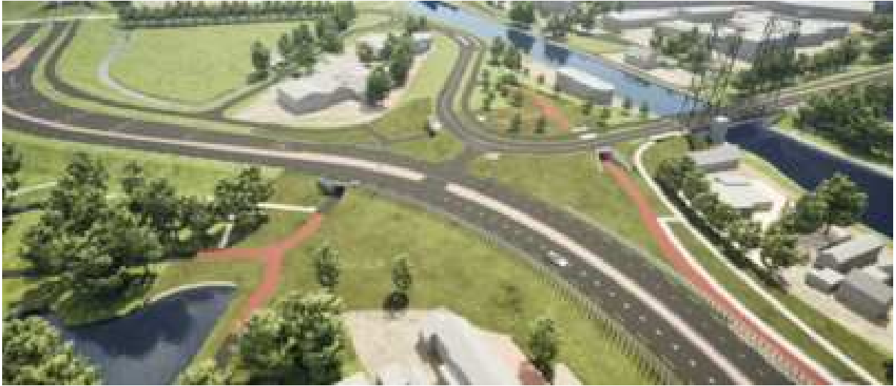
De aanvankelijk geplande fietstunnel onder de Steekterweg vlakbij de Hefbrug (rechts), gezien uit de richting van de Steekterbrug.

de westzijde van de brug komen. Fietsers die van de Alphense wijk Gouwsluis naar Berendrecht willen rijden, of omgekeerd, zouden dan niet meer een grote omweg, met tunnels en op-en-af hoeven te rijden, maar zouden in grote lijnen de ‘binnenbocht’ kunnen maken: van het fietspad over de Hefbrug, via een nieuwe tunnel onder de Steekterweg door (direct ten oosten van de Hefbrug) naar het fietspad aan de westzijde van de Steekterbrug, en dan direct door naar het fietspad over de Oranje Nassaubrug. Een van de grote knelpunten uit ons online knelpuntenoverzicht (nummer 6 in onze Top 10 van knelpunten uit december 2018) zou daarmee zijn opgelost.