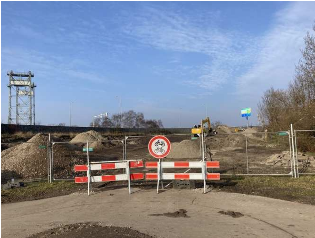
Fietspad naar Steekterbrug afgesloten en vervolgens verwijderd.

In november 2025 hebben we met de provincie overlegd over de langdurige afsluiting voor fietsers. We waren daarover zeer teleurgesteld, maar konden de afsluiting niet voorkomen. Vanaf 7 januari 2026 zouden fietsers niet meer over de Steekterbrug kunnen.