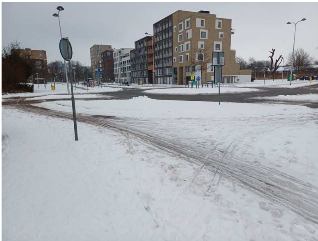
Rotonde Thorbeckestraat: voor auto's sneeuwvrij, voor fietsers (nog) niet.