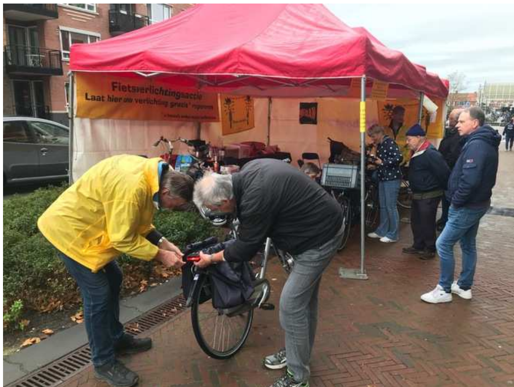
De stand in Alphen aan den Rijn op 1 november.

Op zaterdag 1 november 2025 vond in onze regio de jaarlijkse fietsverlichtingsactie plaats. De Fietsersbond stond die dag weer met een stand aan De Vest in het centrum van Alphen aan den Rijn.