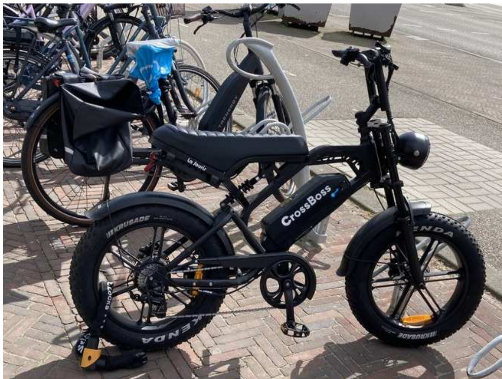
Fatbike bij daglicht.