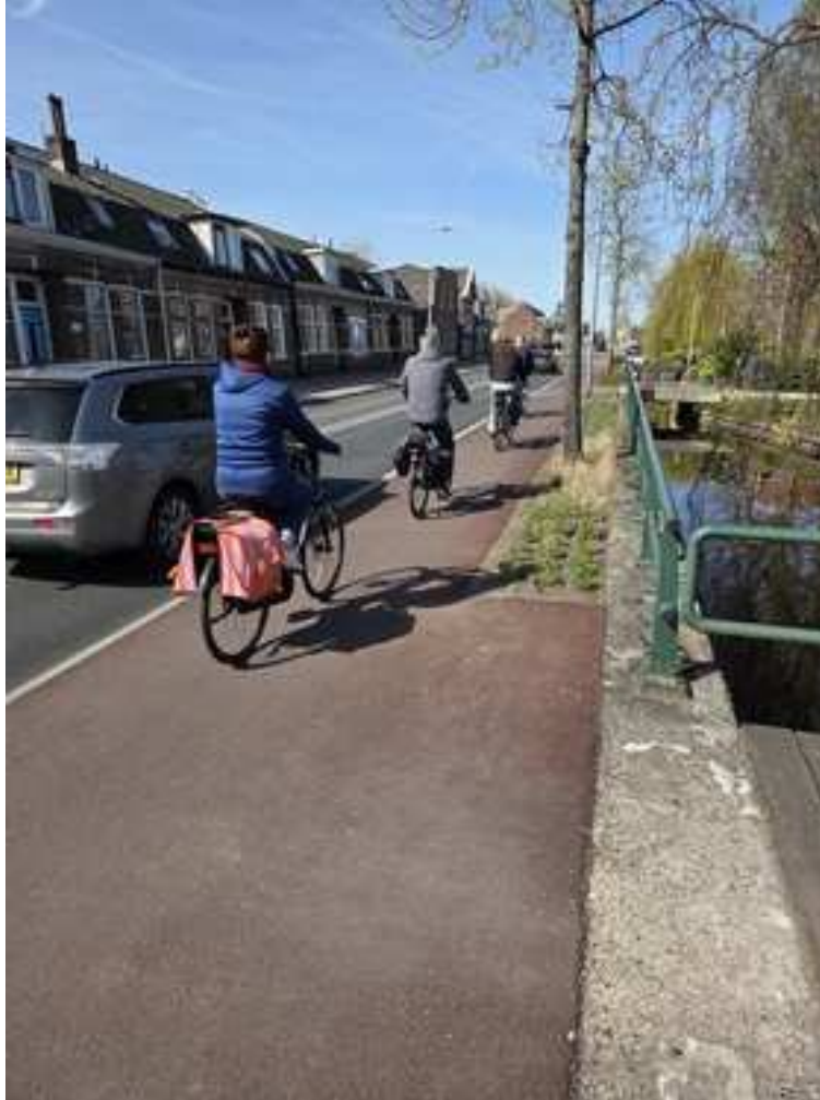
Geasfalteerd fietspad langs Zijde.

De Fietsersbond is erg blij met de reconstructie van de Zijde in Boskoop. Het gedeelte van het Torenpad tot de spoorwegovergang is gereed. Het nieuwe fietspad aan de waterzijde is keurig rood geasfalteerd, het fietspad ligt nu vlakker en de uitritten zijn niet meer schuin, dit is mede mogelijk door het verhogen van de rijbaan. Aan de huizenkant is het fietspad opnieuw bestraat met rode 30x30 tegels, asphalt was hier niet mogelijk i.v.m. de leidingen onder de bestrating.