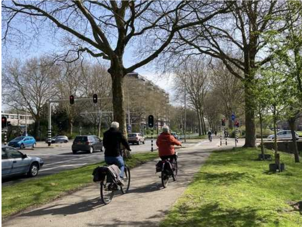
Fietsers langs Burgemeester Bruins Slotsingel naderen Zonneweg.