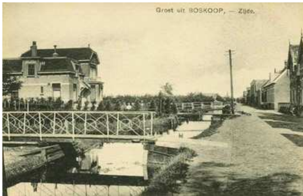
Groet uit Boskoop, - Zijde (1910).