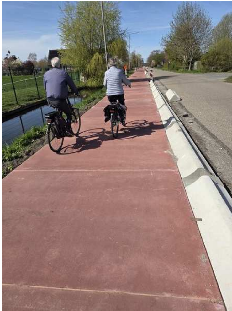
Fietsen op het reeds vernieuwde deel van het fietspad.

Dit voorjaar zijn Hoogheemraadschap Rijnland en de gemeente Alphen aan den Rijn begonnen aan een versteviging van de dijk, en een vernieuwing van de rijbaan en het fietspad. Hierbij worden de zeskantige tegels van het fietspad vervangen door Easypath betonplaten, precies zoals we in ons knelpuntenoverzicht adviseren. Op het moment van schrijven is de helft van het fietspad vernieuwd. De rest zal spoedig volgen. Voor de zomer moet het dus een stuk fijner fietsen worden langs het Westeinde, gewoon op het fietspad.