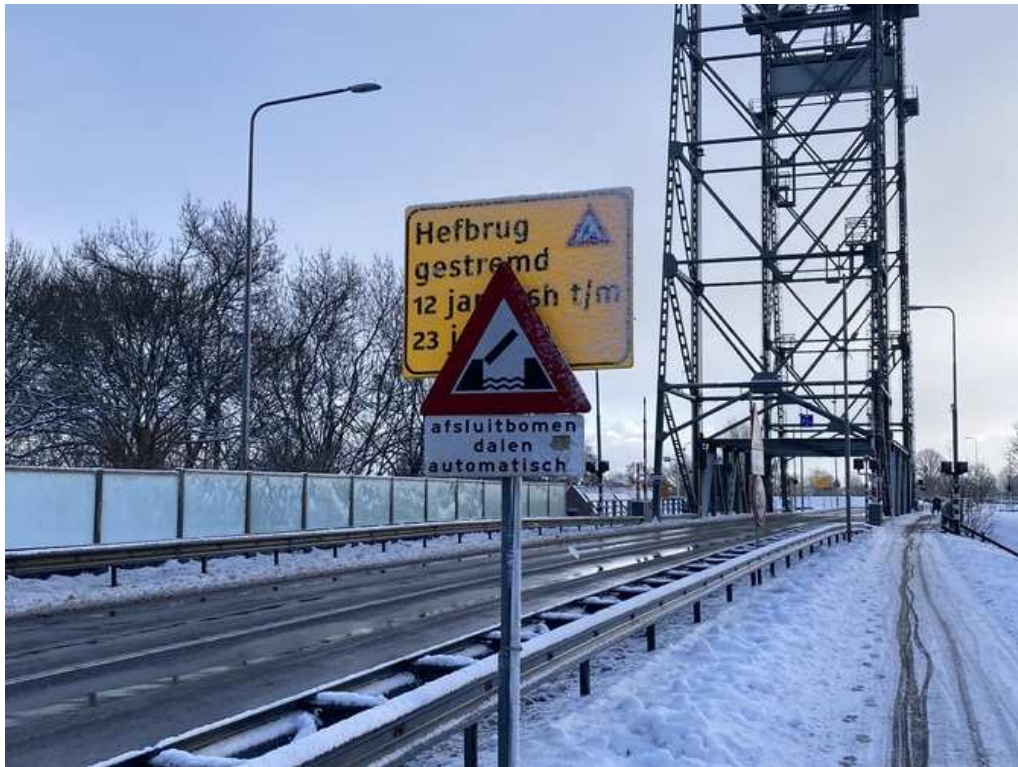
Aankondiging van afsluiting Hefbrug.

Begin januari 2026 zou de Steekterbrug worden afgesloten voor fietsers. Die week kreeg de Fietsersbond meldingen van bewoners van de Steekterweg in Alphen aan den Rijn dat ook de Hefbrug twee weken zou worden afgesloten voor alle verkeer, vanwege noodzakelijk onderhoud. Hoe zouden zij in die periode dan nog Alphen in en uit kunnen op de fiets?